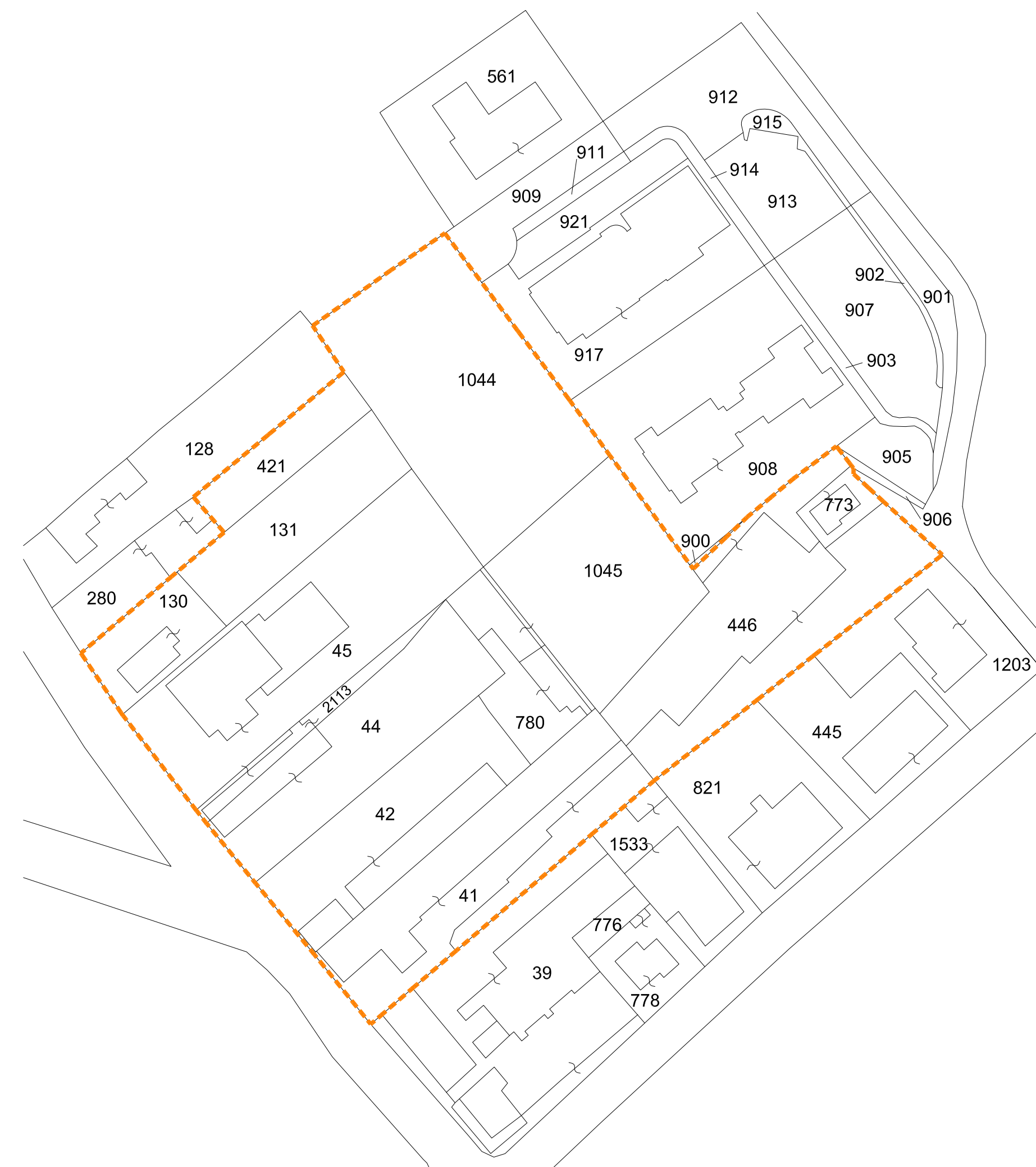
PLANIMETRIA CATASTALE 1:1000