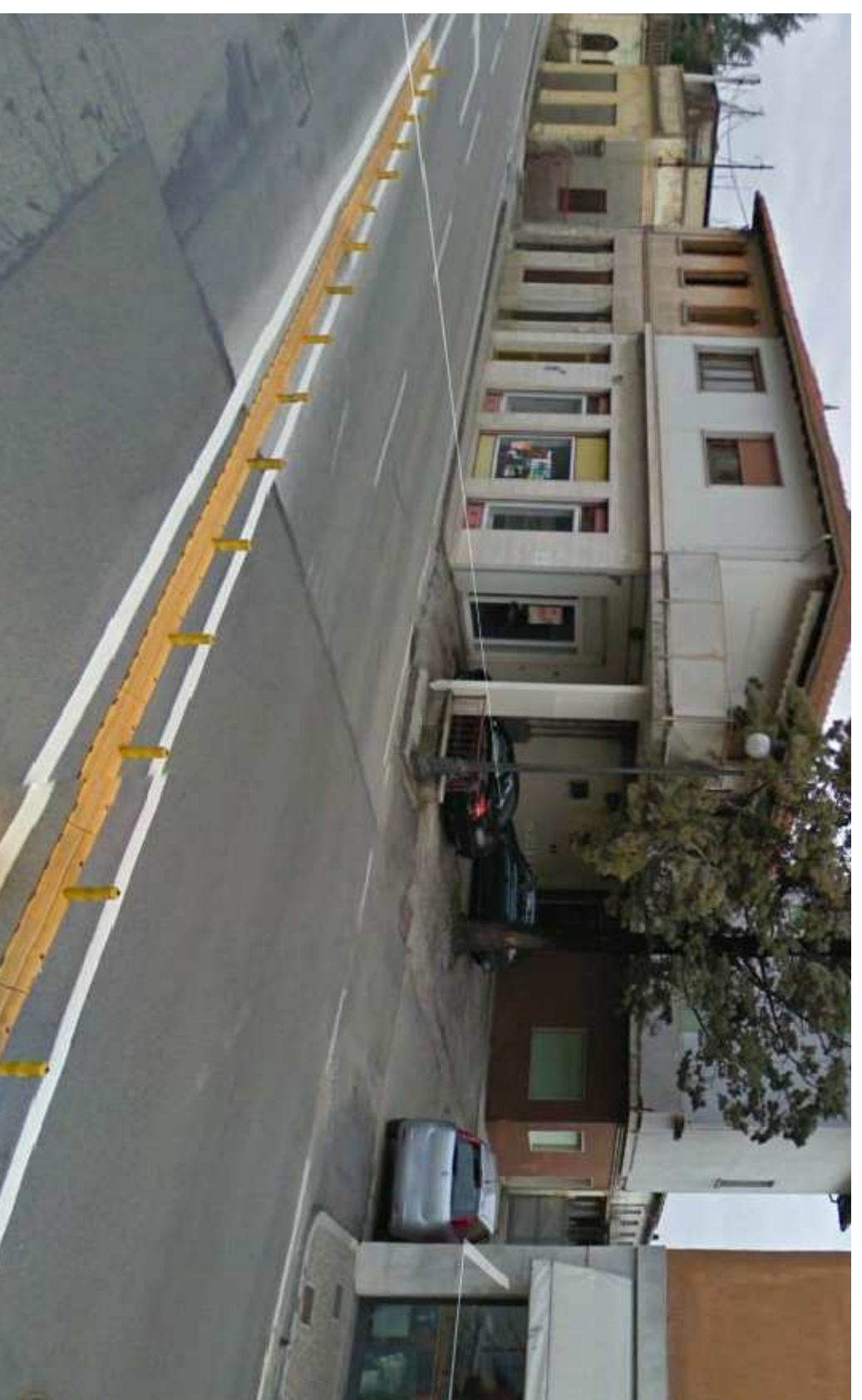
Foto 5. Incontro via Trento - nuova viabilità PRPC