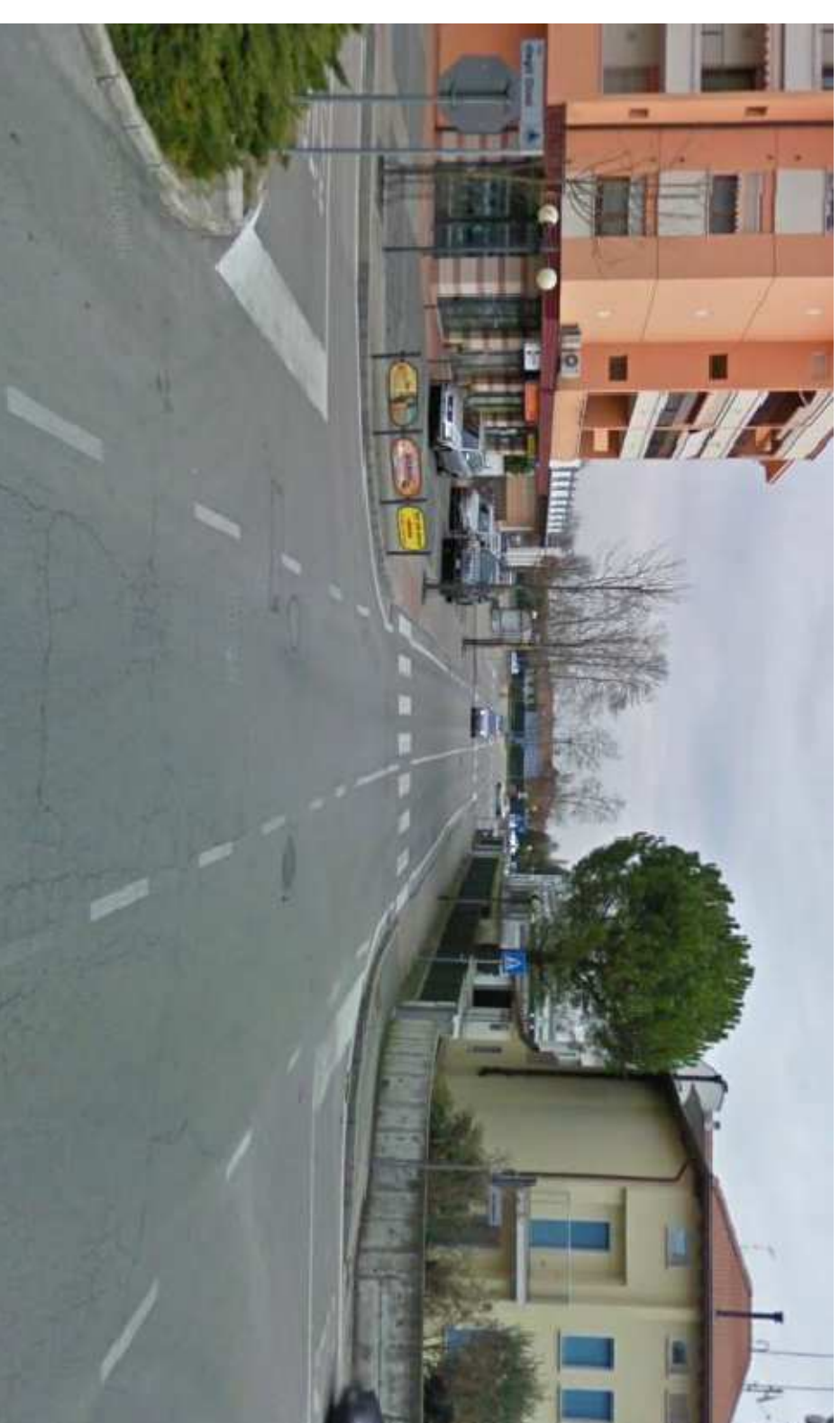
Foto 4. Incontro via Verdi - via degli Olmi - via del Donatore