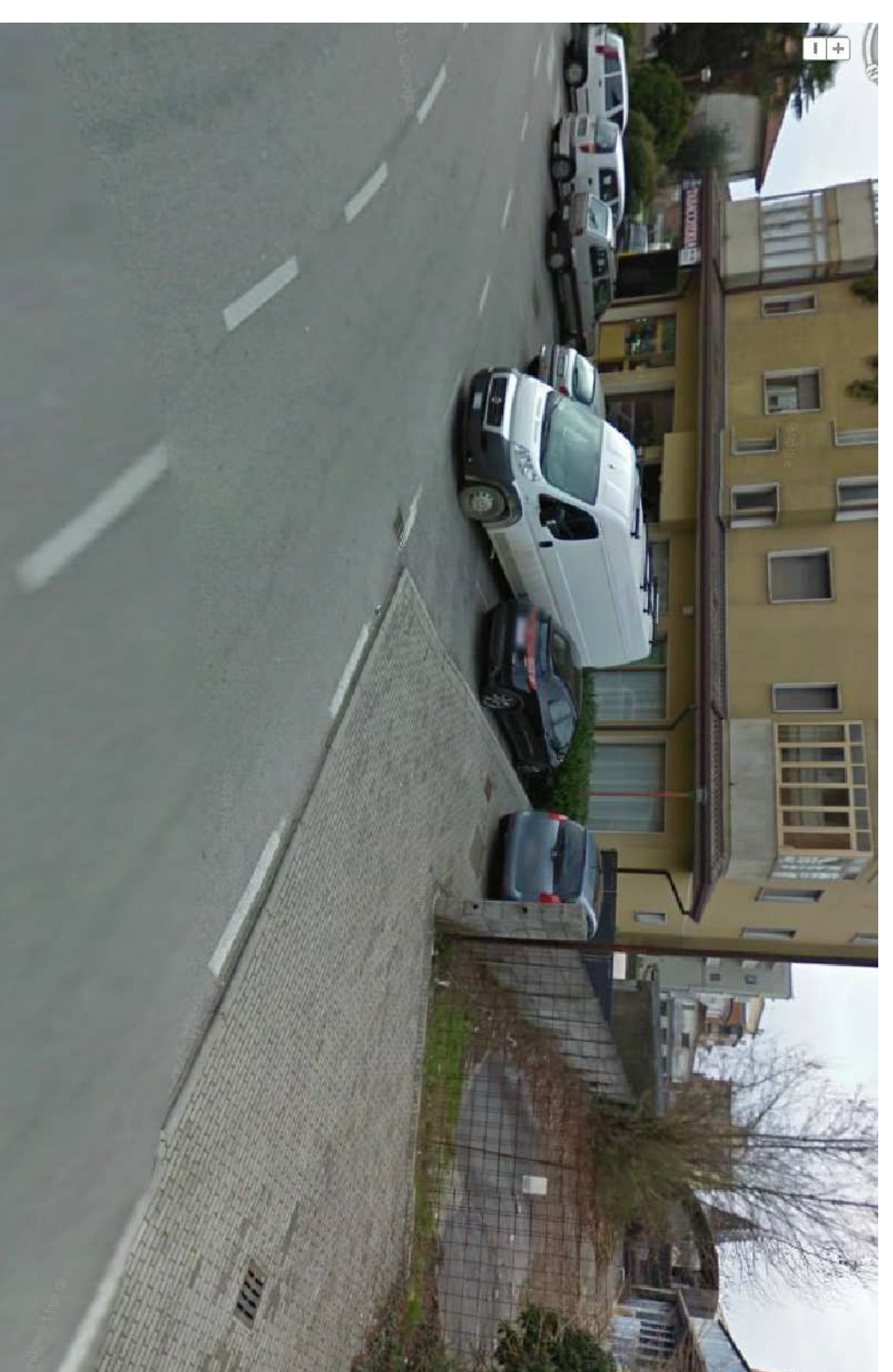
Foto 2. Incontro via degli Olmi - nuova viabilità PRPC