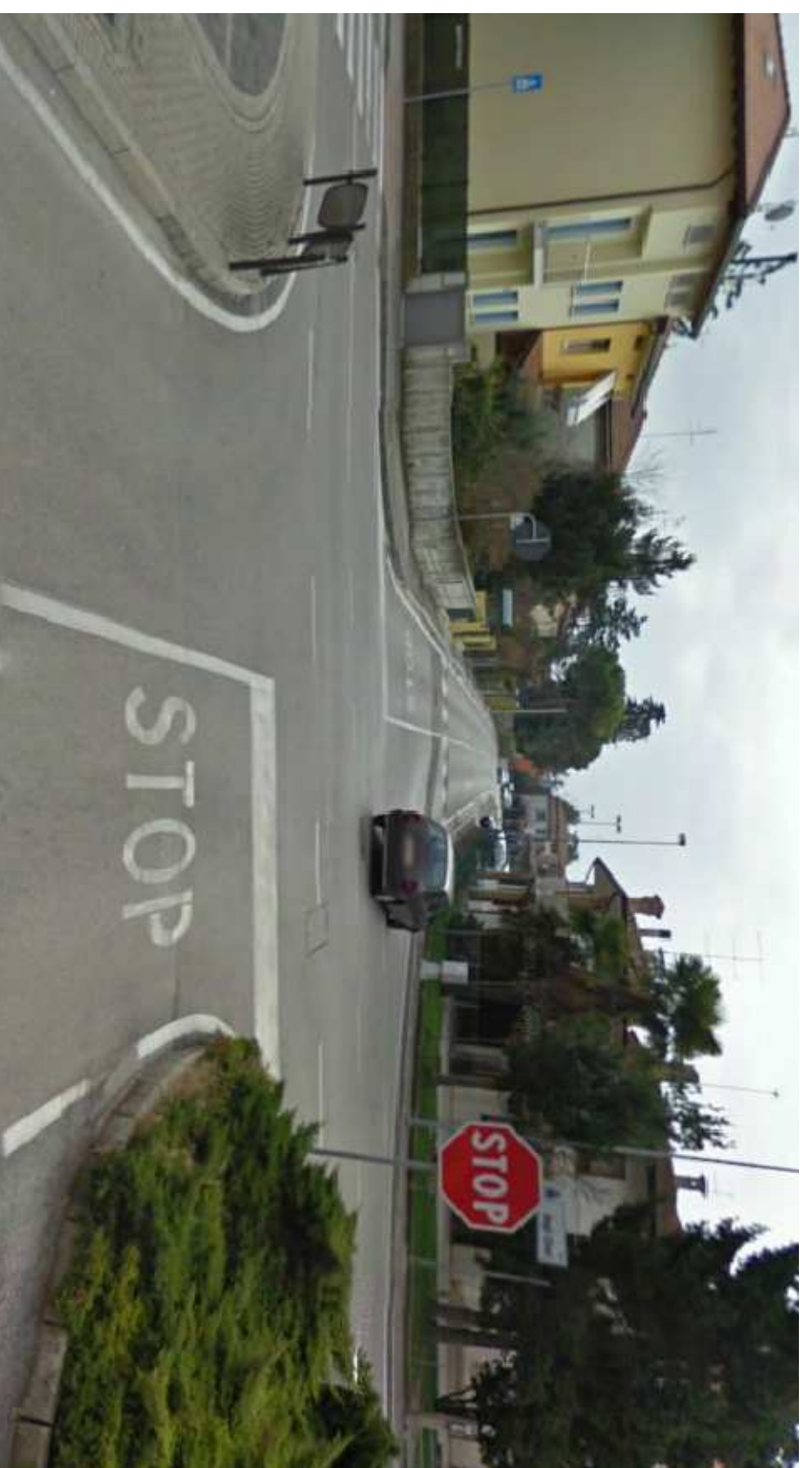
Foto 3. Incontro via Verdi - via degli Olmi - via del Donatore