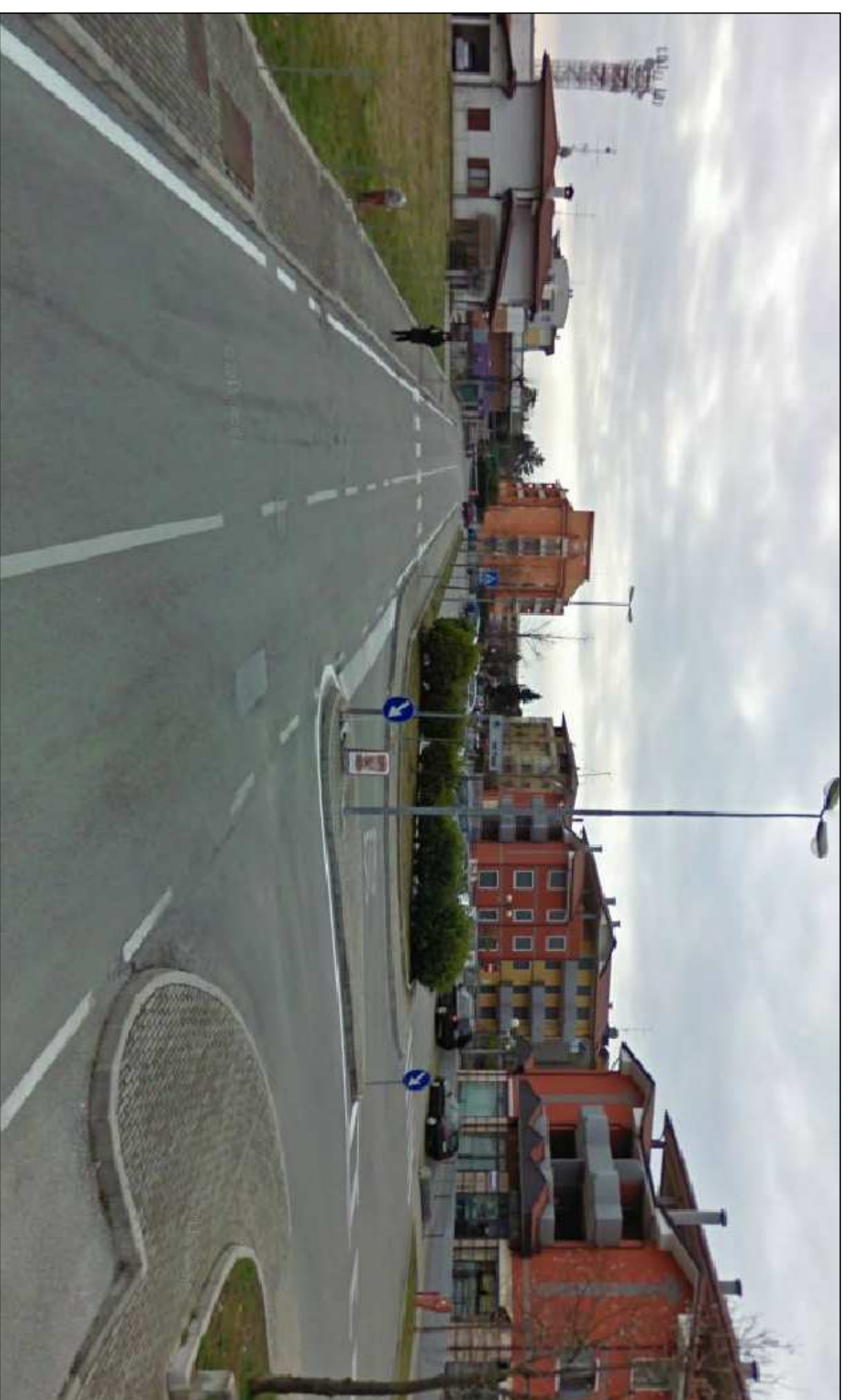
Foto 1. Incontro via degli Olmi - via dei Faggi