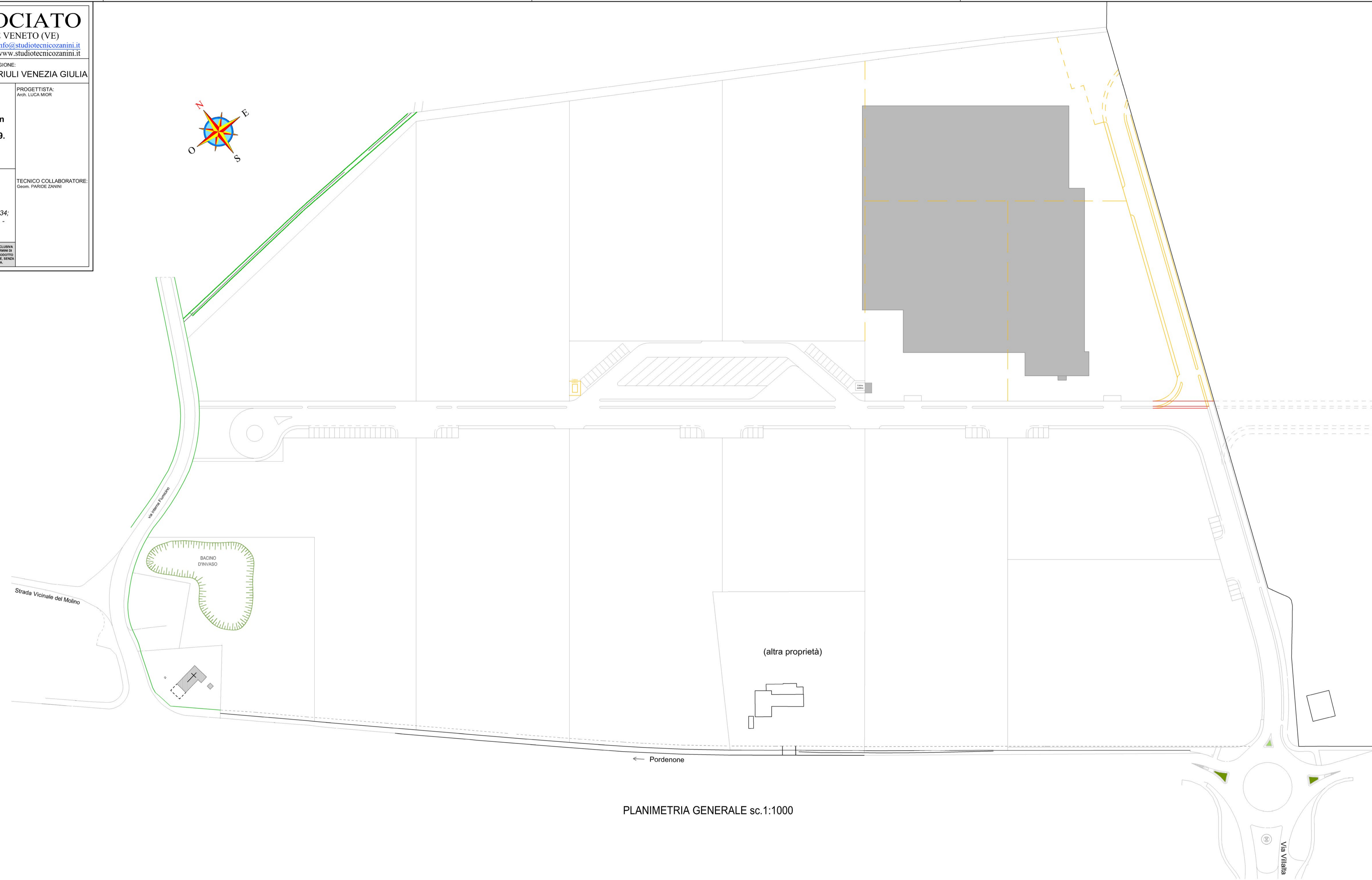
PLANIMETRIA GENERALE sc.1:1000